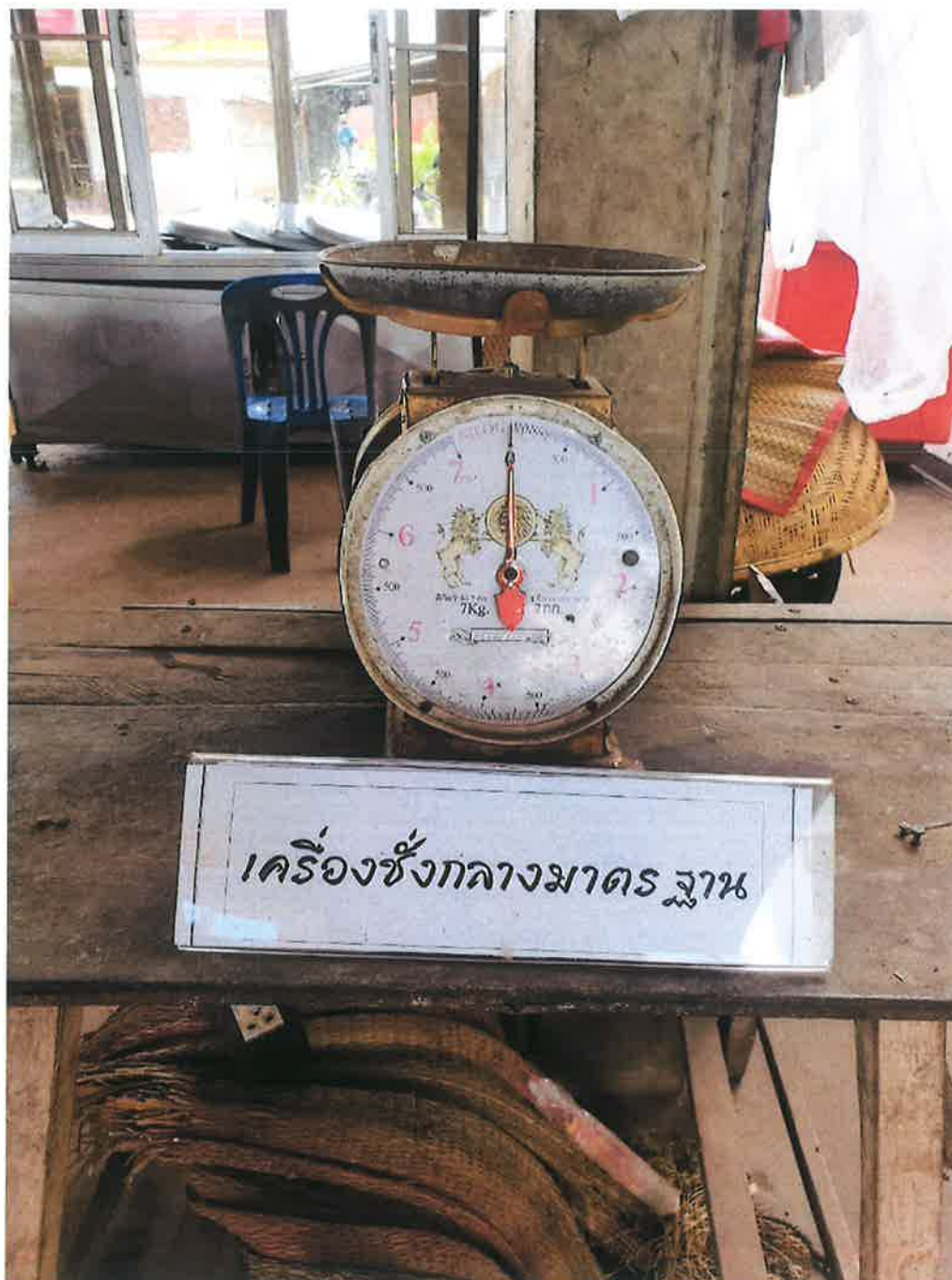
เครื่องชั่งกลางมาตรฐาน